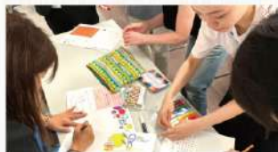
「みらいこども財団」へのポイント寄付