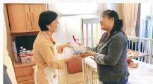
「キープ・スマイリング」へのポイント寄付