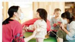
「こどもホスピス」への特典・ポイント寄付