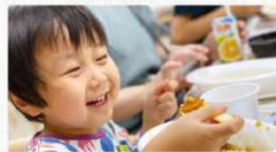
「こども食堂」へのポイント寄付